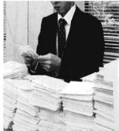
ハガキに目を通す担当官