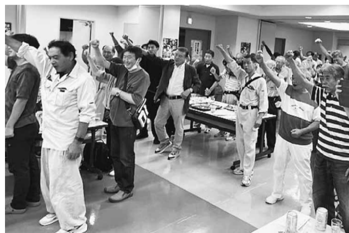
80名の参加者、残りの1カ月の奮闘をみんなで約束しました。

仲間づくり運動の成功には多くの仲間の協力が必要です。夜間行動に参加するのが無理でも、現場の仲間でも組合に入っていない人を知って、高いと愚痴っ