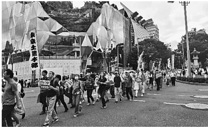
今年4月オープンした東急プラザ「ハラカド」を背にデモ行進

代々木公園で開催された「9.16さようなら原発全国集会」に参加。朝方雨模様だったが、会場に着くや暑い日差しが晴天となった。北支部4名を含む東京土建168名、全国から5千人が集結との報告。ステージでオープニングライブが始まっております。何故か活気が感じられなかったが、原発再稼働各地域団体のスピーチは力強く感じられた。 我々のデモ行進は、前回同様の表参道を経由して外