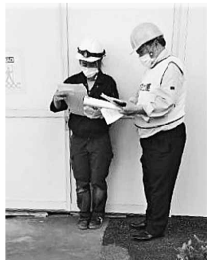
現場でのアンケートの様子

9月26日、北支部 全国で多発している部賃金対策部・P A L会員・労働対 策部合同の全国労働衛生週間現場訪問行動を行いました。 北支部では、この間年3回現場訪問行動を行っています。現場での死亡災害事故が支所では、昨年の 7月から北区公契約条例が全面施行され、職種ごとに最低報酬下限額が決定し、全ての現場従事者に賃金が引き渡されているかどうかでも重要な課題です。 今回の訪問行動で明らかになったのは、現場監督は公契約条例適用現場との認識はありましたが、現場労働者に対する周知はされていないように見受けられました。北支部では引き続き現場訪問行動を強化していきます。