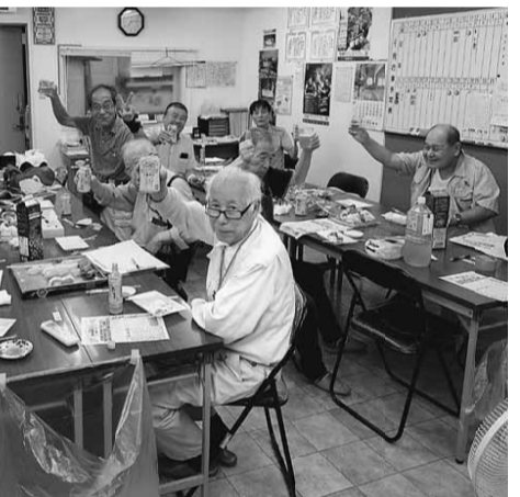
豊王分会では出陣式に13名の参加 2か月間、明るく行動に取り組みます！

で確認しました。その後9月1日には役員研修をおこない、第一次行動では各分会出陣式を実施。北赤羽分会は若手からベテランまで12名の参加、今