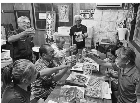
夜間行動に参加するのが難しくても、お手伝いいただける事はたくさんあります！団結して頑張りましょう！