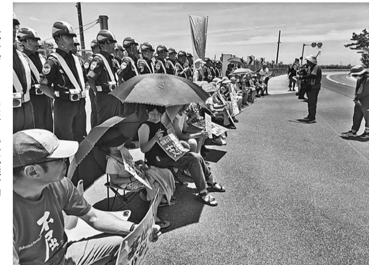
辺野古ゲートでの座り込み抗議行動 死亡事故があったにもかかわらず工事強行

政府も台湾有事、中国の脅威を煽る事ばかりでは無く、世界に誇る憲法9条を盾に平和を推進させる事を願いたい(平和ボケとは良い言葉です、平和でなければボケれませんから)。