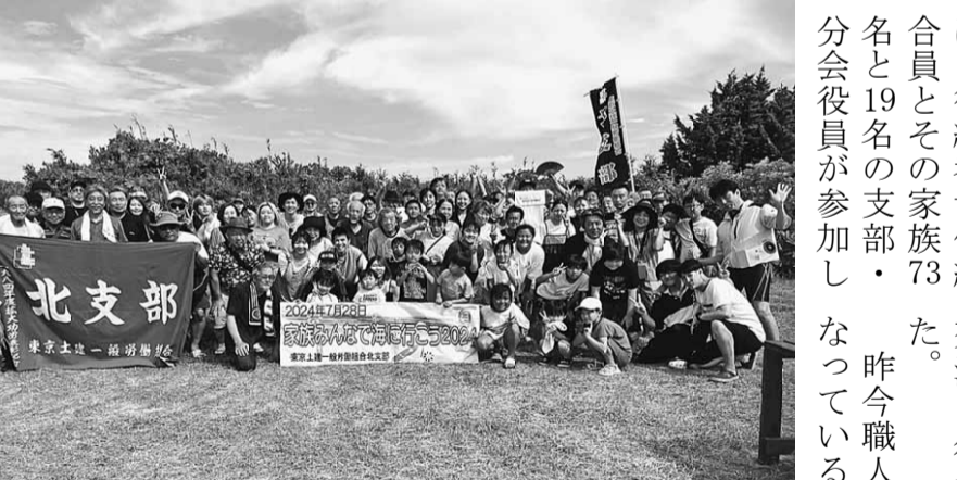
後継者主催の夏のイベント 今年は規模を大幅に拡大しての開催となりました

要望の中身は支 部からの国保予算 確保や、各種の建 設関連の要望とあ わせて「大学生向 けの奨学金創設」 「王子駅、赤羽駅 における子乗せ自 転車の定期利用駐 輪場増設のお願い 」の2点をお伝え しました。