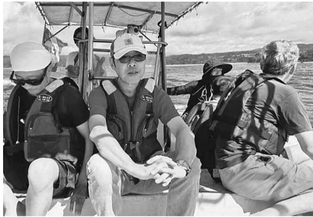
辺野古周辺は変わらず美しい海ですが、浜は環境破壊が進み茶色く濁った場所も

沖縄と言えば、美ら海水族館、国際通りでの買い物、青い空、透き通った海、最近ではアメリカカンピレツジなど観光地としては最高の場所だと思ふ。私も今回を含め5回程沖縄に行った。その内の1回は20代の頃。観光目的で訪問し、レンタカーを借り国道を走っているとやたらと大きい施設があった。米軍の嘉手納基地だった。その頃は何も意識すること無く、ただ、ただ、通り過ぎた。広島、長崎の原水禁に参加したのをきっかけに平和問題に高い関心を持ち始め、色々と学習機会もあつて今日に至る。