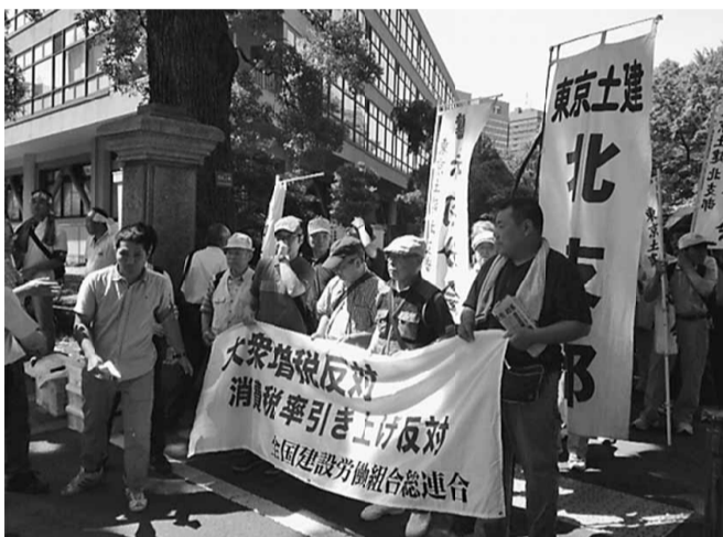
全建総連生活危機突破中央大会 デモ行進の様子

7月2日、都庁第二庁舎にて予算要求集会および午後からは、日比谷公園にて中央総決起集会が開かれました。北支部の参加人数は51名でした。