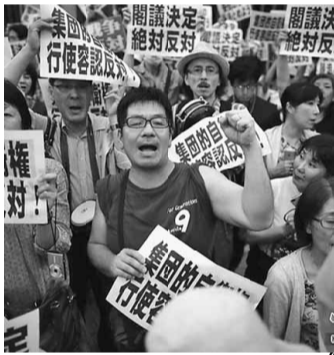
集団的自衛権抗議行動の様子

人の力は小さくとも国民みんなが力を合わせれば、国を動かすことができる。今こそ声を上げ、力を合わせましょう！日本と世界の平和を守るために！！